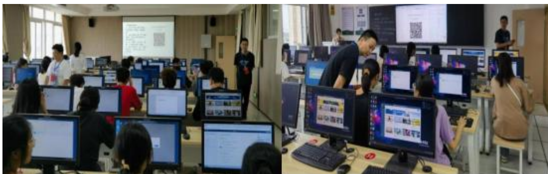
图为数学与计算机学院“计算机基础分层考试”监考现场