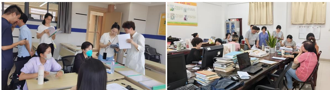
图为检查小组在音乐舞蹈学院、文化与旅游学院检查现场

估与督导中心分成7个小组，对本学期二级学院（部）基层教学组织第一次教研活动开展情况进行检查。